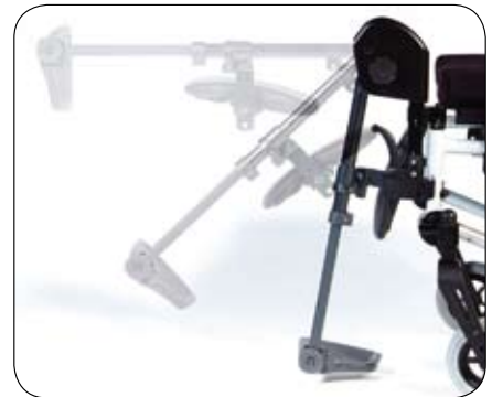
Podnoszony podnóżek (opcja)