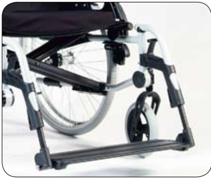
Płyta podnóżka i drążek stabilizujący w celu zwiększonej sztywności i wsparcia (opcja wzmocniona XL)