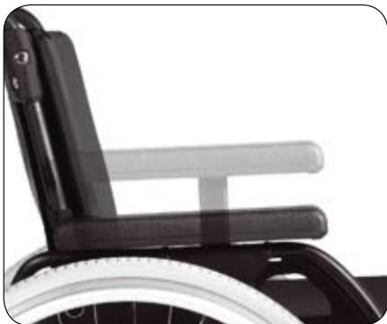
Podłokietnik o regulowanej wysokości (opcja)