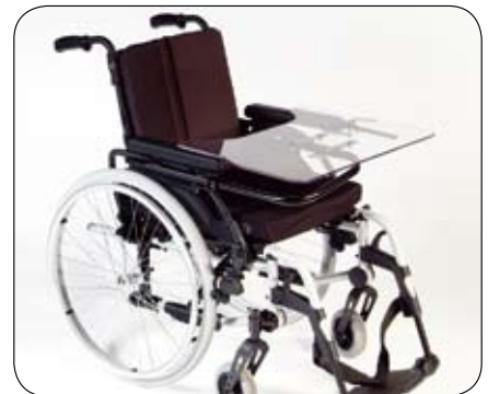
Dostępne opcje dla stolika. Nasuwany i odchylany (na rysunku).