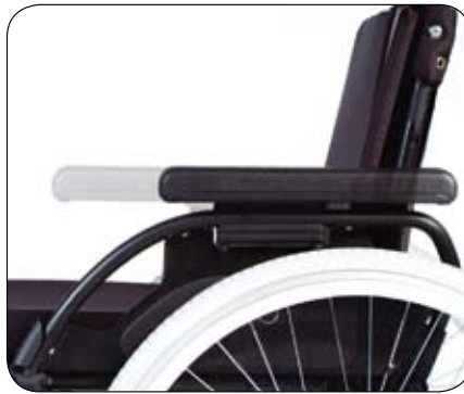
Regulowana długość podłokietnika