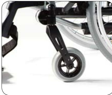
Regulacja wysokości siedziska możliwa dzięki obudowie kółka samonastawnego i widełek