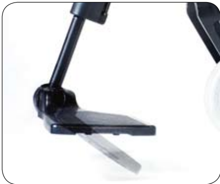
Kąt (+/- 15°) i wysokość podnóżka regulowane