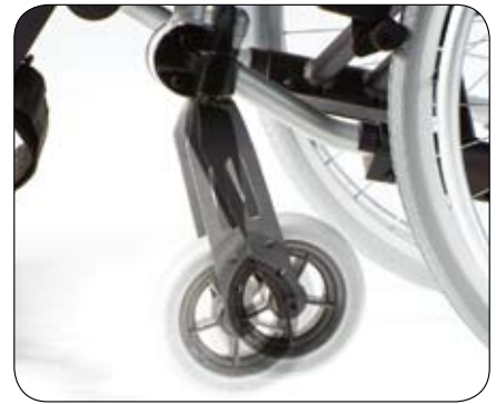
Regulowany kąt siedziska (0°, 3° & 6°)