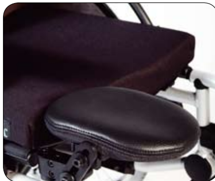
Podpórka pod kikut (opcja)